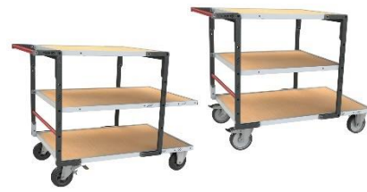
Différentes combinaisons de plateaux