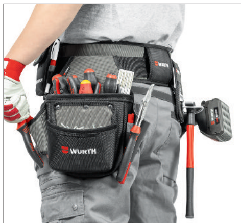
Livré sans outils.