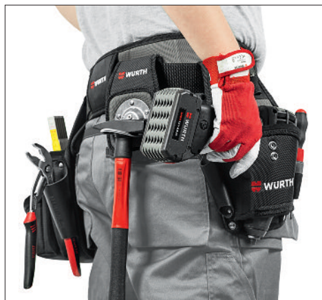
Livré sans outils.