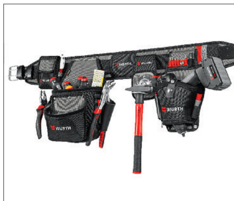
Livré sans outils.