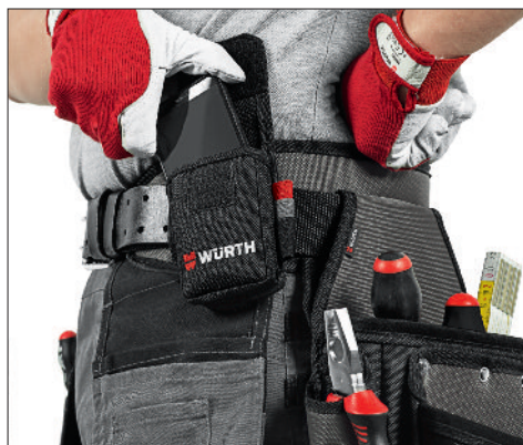
Livré sans outils et téléphone.