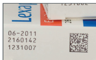
Marquage sur carton vernis