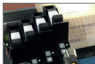
Marquage sur carton poreux