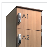
Version extérieure bois