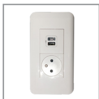
Prise standard + 2 ports USB en option