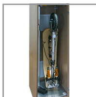
Rangement trottinette dans casier inférieur