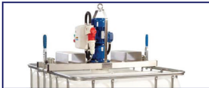
Entraînement électrique avec cadre chariot élévateur

La fixation pour l'entraînement du mélangeur IBC est un pont léger en inox facile à manipuler qui se monte directement sur le cadre de l'IBC et est maintenu en place par des brides de serrage à action rapide.