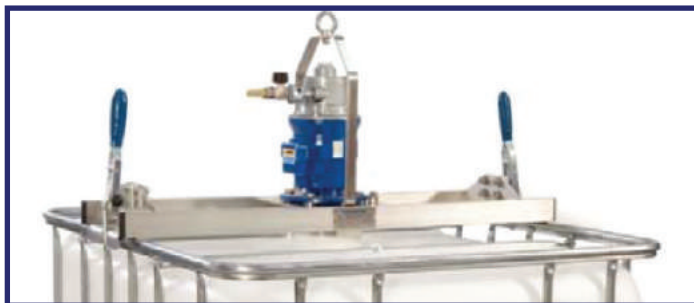
Entraînement pneumatique avec cadre standard