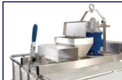
Trémie à poudre

Des ponts mélangeurs sont disponibles, qui comprennent une trémie pour introduire des poudres ou deux connexions d'entrée BSP 1 pouce pour introduire des liquides dans l'IBC avec le mélangeur en position, les deux options sont disponibles sur le même pont mélangeur