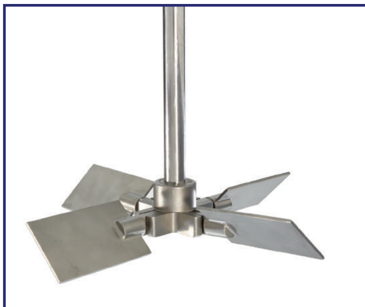
Hélice pliante E-400 en position de fonctionnement