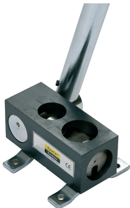
PIC: EK 2