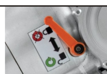
Levier pour rotation de la tête à 180°