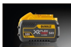
Batterie Lithium Ion 18V-54V