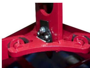
Verrouillage et déverrouillage automatique