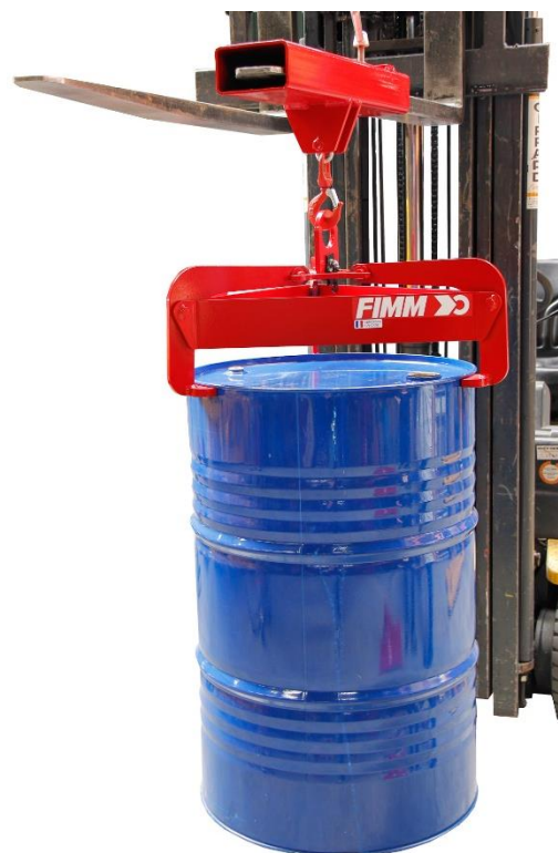
Pince présentée avec l'option fourreau

Par ailleurs, comme rien ne devrait justifier de jeter un produit sous prétexte qu'il soit abîmé, nous sommes en capacité de remettre en état d'usage tous les matériels de notre fabrication et ce, sans limite de durée.