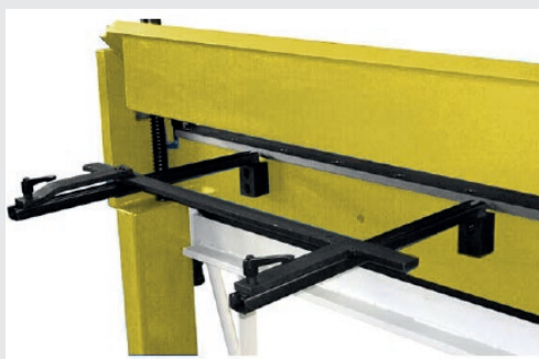
FIG.: OPTION BUTÉE ARRIÈRE (RÉGLABLE MANUELLEMENT)