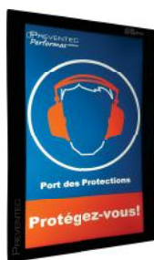
Exemple de pictogramme