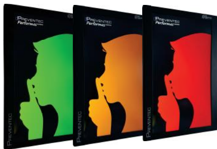
Acceptable Préoccupant premier seuil Trop élevé deuxième seuil