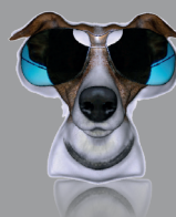
DÉCORATION DE MAGASIN RÉALISÉE PAR ANAMORPHOSE SHOP DECORATION PRODUCED BY ANAMORPHOSIS