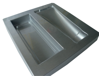
CALAGE COSMÉTIQUE WEDGING ELEMENT FOR COSMETICS