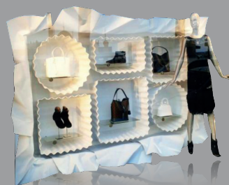
VITRINE EN ABS BLANC MAT MATT WHITE ABS WINDOW DISPLAY