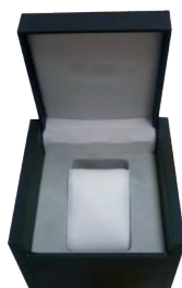
CALAGE EN MATIÈRE FLOCKÉE POUR COFFRET MONTRE FLOCKED INSERT FOR WATCH CASE