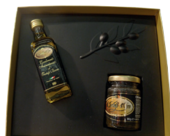
CALAGE POUR ÉPICERIE FINE DELICATESSEN WEDGING ELEMENT