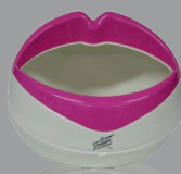
SEAU À GLACE - ICE BUCKET

Deliver an outstanding customer experience by inviting them to delve into your own universe. Material, color or transparency effects, straight-lined and geometric design, oversize... RBL stages your brand for a successful experience.