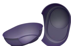
CALAGE POUR ENCEINTES HAUT DE GAMME WEDGING ELEMENT FOR HIGH-END SPEAKERS

It is your first communication medium. RBL provides you with the solution that meets perfectly your requirements and the double goal of your packaging: protect and highlight your product.