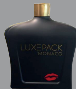
FACTICE GÉANT (DIMENSIONS: 350 X 150 X 450 MM) GIANT FACTICE