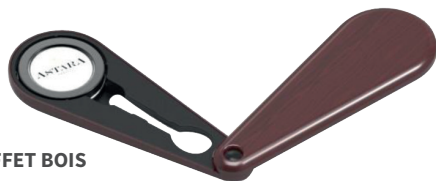
COFFRET CAVIAR - MATIÈRE EFFET BOIS CAVIAR CASE - WOOD EFFECT