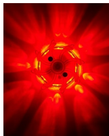
Éclairage 360° - visible à 1 Km

La lampe PULSAR multi mode est rechargeable, conçue pour la signalisation (intervention trafic, sécurisation d'accident...). Il y'a 10 modes: Rotation / SOS / Quadri flash / Clignotement / Clignotement alternatif / Continu 100% / Continu 50% / Continu 2 LED / Continu 4 LED / Torche Blanche). Cet éclairage au design unique est conçu pour résister aux chocs (résiste à un écrasement jusqu'à 1 tonne) et à une immersion pouvant aller jusqu'à 10m. Le PULSAR est également équipé d'un aimant permettant de le positionner sur n'importe quelle surface métallique.