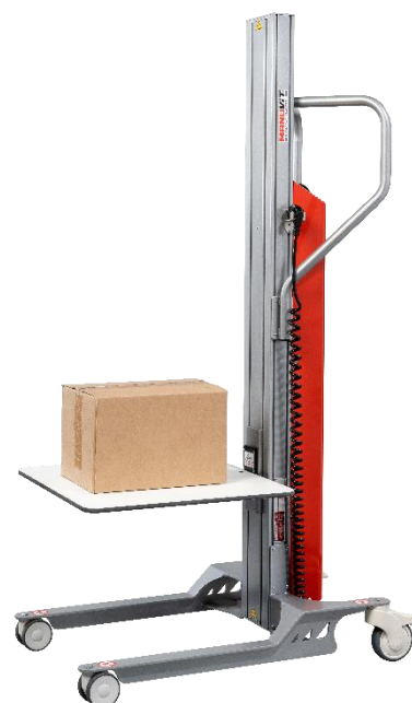
Équipé de l'accessoire plateau