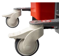
Roues à frein en polyuréthane