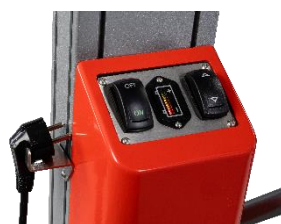
Indicateur de charge