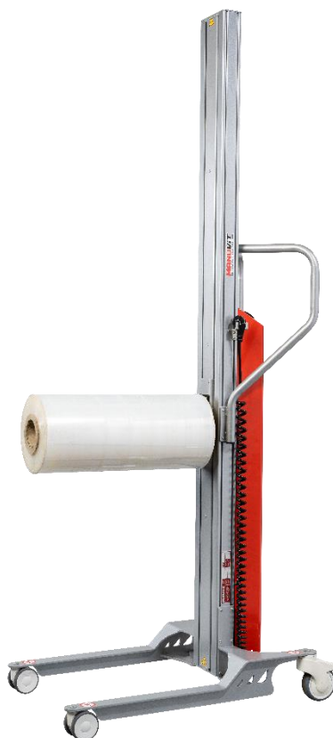
Équipé de l'accessoire éperon

Conformes à la directive machine 2006/42/CE. Répondent aux recommandations de la CRAM R-367.