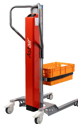
Équipé de l'accessoire fourches