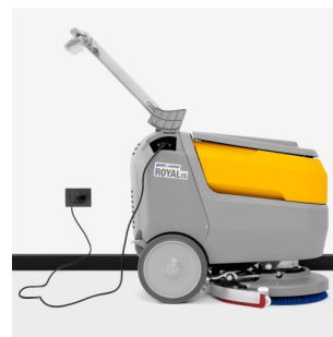
18.0103.01 Chargeur a bord 24V 9A