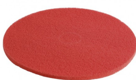
C15-RE PAD NYLON ROUGE DIA 380 MM (par 6)