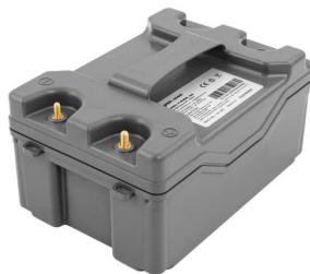
18.0108.00 Batterie Lithium 24V 547 Wh