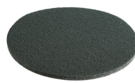
C15-GR PAD NYLON VERT DIA 380 MM (par 6)