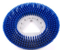
40.0008.00 BROSSE POLYPROPYLÈNE DIA. 0,7MM - 380MM