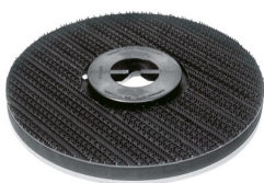
40.1008.00 Porte pad 355mm (pour 15" pad)