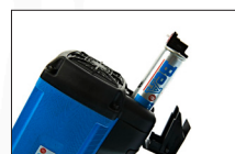
Facile à recharger