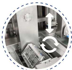
Rotation et balancement pour optimiser l'effet bain