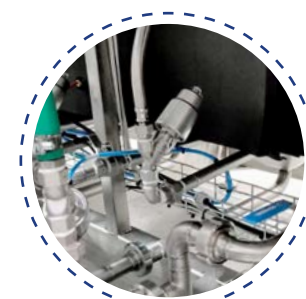
Remplissage et vidage automatique