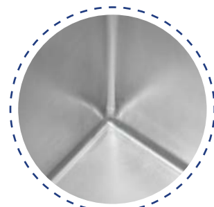
Finitions hautement hygiéniques