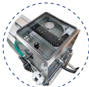
Systèmes avancés de séparation d'huile