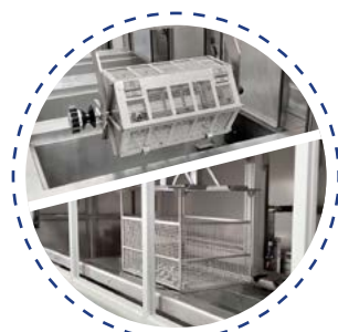
Supports sur mesure avec chargement en vrac, etc.