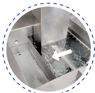
Système de décantation d'huile