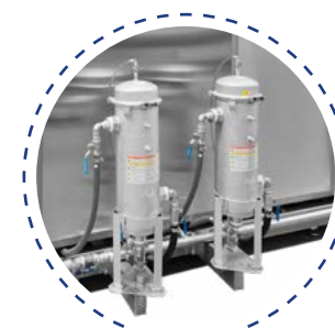
Filtres à sac de 10 à 200 my