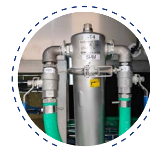
Filtration fine de 1 à 10 my