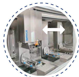
Transport automatique de paniers