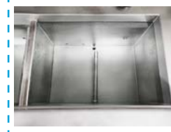
Bains de protection