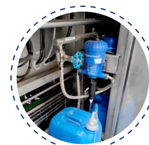
Système de dosage automatique de détergent