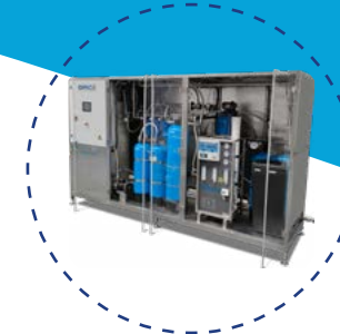
Stations de traitement des eaux