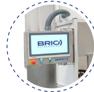
Programmes avec enregistrement et traçabilité