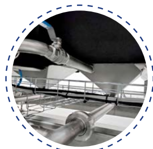
Fond conique pour un nettoyage optimal