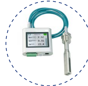
Contrôle de la saturation du bain