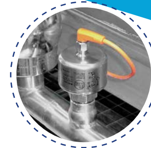
Capteurs de conductivité et de pH