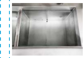
Séchage à l'air chaud