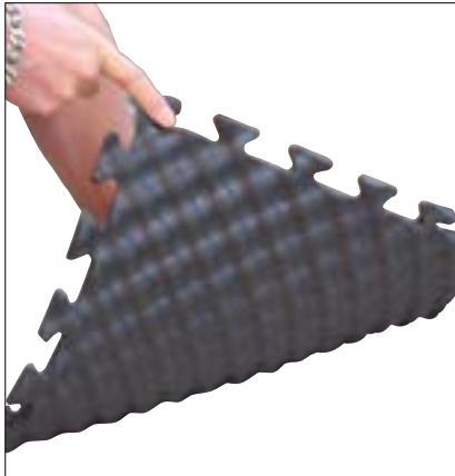
La géométrie spécifique du SOLCLIP® 18 garantit le confort du travail en position debout.