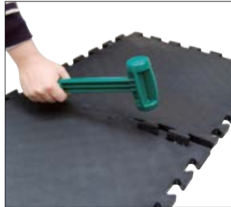
L'assemblage des éléments se fait simplement avec un maillet.