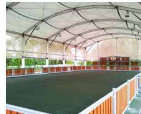
Préau multisport Saints (77)