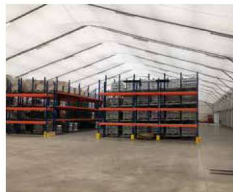
Atelier municipal, Sarreguemines (57)