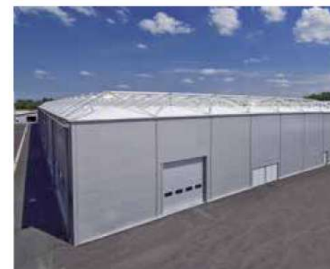
Parc Expo Tours (37)