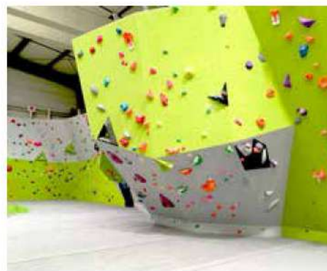
Salle d'escalade de Colmar (68)