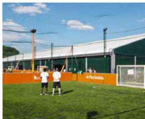
Urban Football Guyancourt (78)