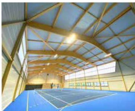
Tennis Club de Castres sur-Gironde (33)