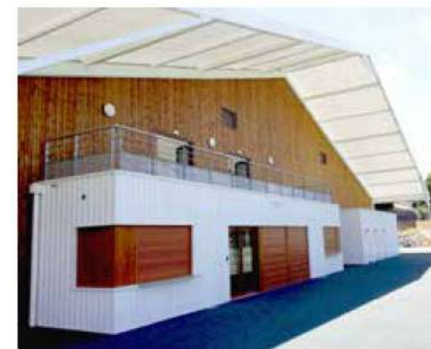
Tennis Club de Saint Pierre de Mont (40)