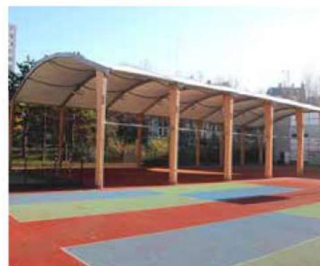
Collège Léon Mottot, Paris (75)