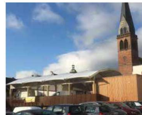
Marché couvert, Ingwiller (67)