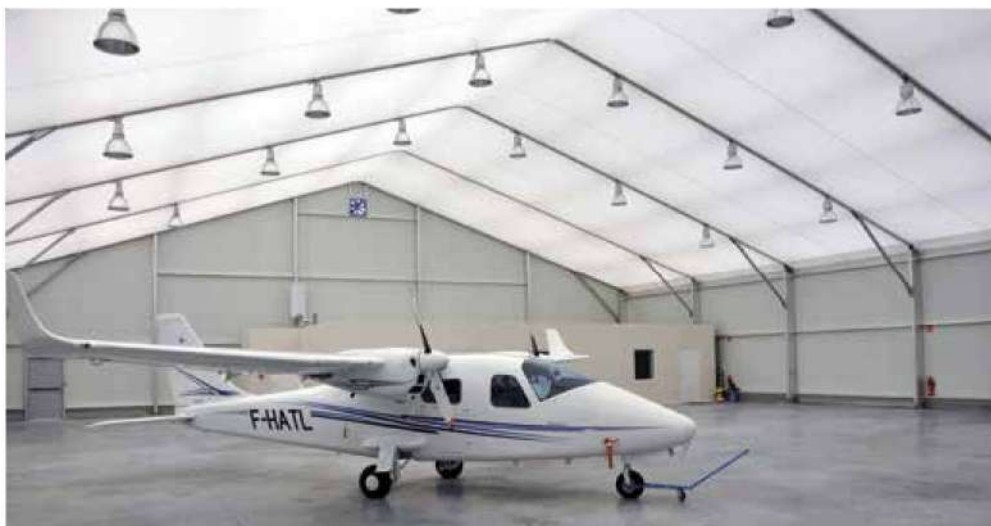
Aérodrome de Bourg en Bresse (01)