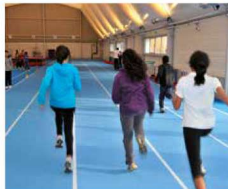
Halle d'athlétisme Aulnay Sous Bois (93)