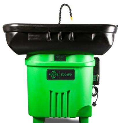
FUCHS ECO BIO V2 XL Réf. 940059922