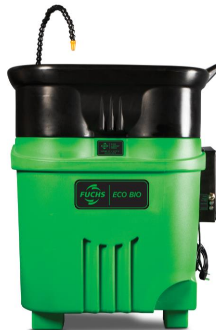
FUCHS ECO BIO Réf. 940059915