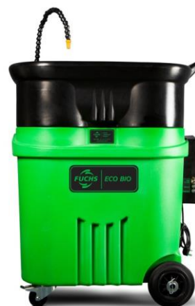
FUCHS ECO BIO V2 MOBILE