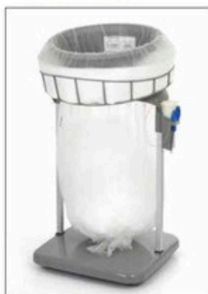
Stand Classic Maxi/Maxi Food