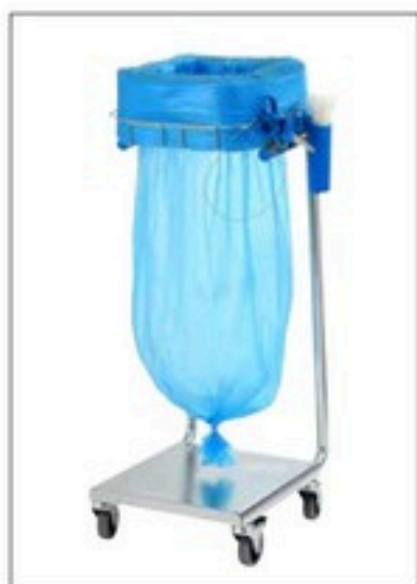
Stand Dynamic Mini/Mini Pedal