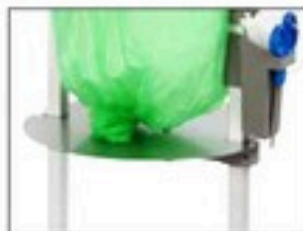
Plaque réglable pour Longopac Stand Classic Mini Item no. 31480 Réduit la consommation de matériau de sac ainsi que la taille du sac. Conçue en premier lieu pour les déchets poisseux et lourds. Peut être utilisée avec les cassettes de sacs Bio.