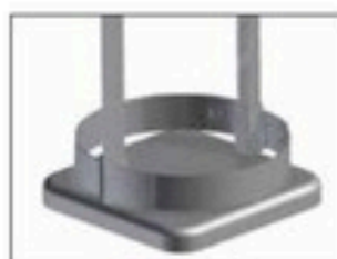
Cadre pour Longopac Stand Classic Maxi Item no. 33900 Le cadre maintient le sac en place.