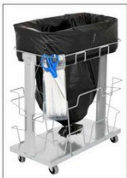
Stand Dynamic UBS