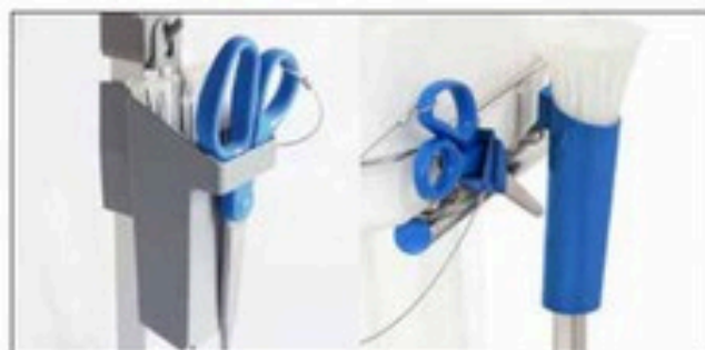
Support d'attaches de câble pour Longopac Stand Classic Standard, gris. N° d'art. 30410 À métal détectable, bleu Item no. 30416 Le support d'attaches de câble permet de remplacer les sacs encore plus rapidement et maintient les attaches en place. Convient à Maxi et Mini et est disponible en deux modèles.