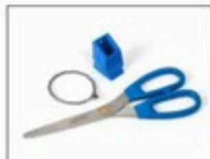
Kit de ciseaux pour Longopac Stand Dynamic, à métal détectable Item no. 34609 Kit contenant des ciseaux à métal détectable, un support de ciseaux et un câble inoxydable.