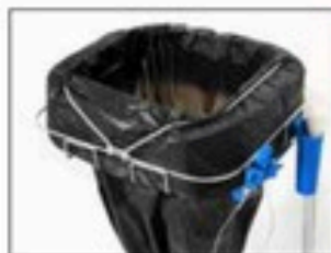
Élastique Item no. 3102 Cet accessoire peut être utilisé pour tous les supports de cassettes Longopac. Verrouille efficacement la cassette et empêche la cassette de se déployer.