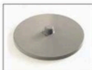
Couvercle pour Longopac Stand Classic Maxi et Mini Item no. 31140 Maxi. N° d'art. 30140