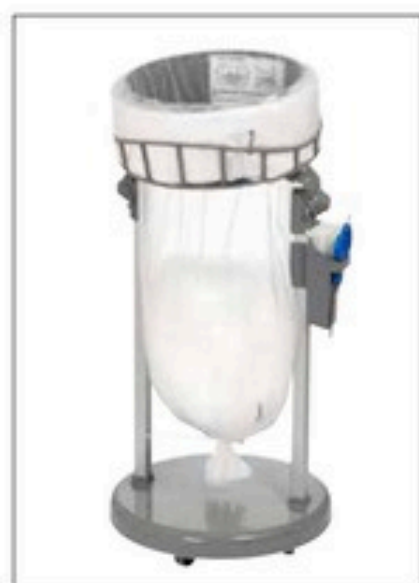
Stand Classic Mini/Mini Food