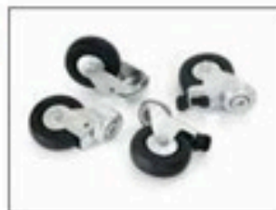
Kit de roulettes, pour Longopac Stand Dynamic, Item no. 34616 Contient quatre roulettes, deux d'entre eux avec des freins. Remplace les roues d'origine sur les stands utilisés dans les zones à accès restreint ESD.