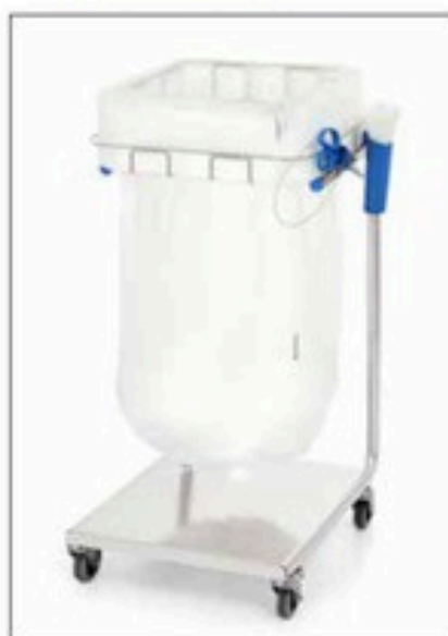
Stand Dynamic Midi/Midi Pedal