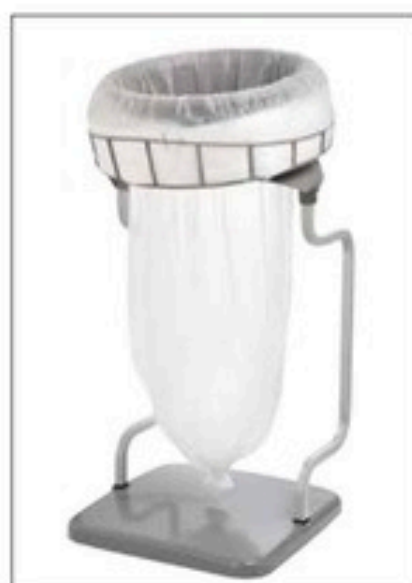
Stand Classic Recycling