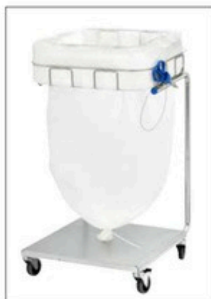
Stand Dynamic Maxi/Maxi Pedal