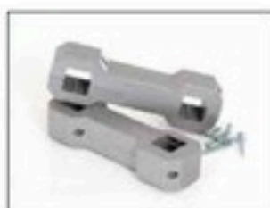
Connecteur de supports pour Longopac Stand Classic Item no. 33750 Pour connecter simplement et solidement deux Longopac Stand ou plus. Il est également possible de connecter Maxi à Mini.