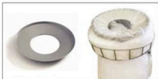
Disque perforé pour Longopac Stand Classic Maxi Item no. 30170 Réduit l'orifice de dépôt, ce qui simplifie la compression du plastique recyclé, par exemple. Uniquement disponible pour Maxi.