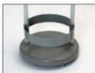
Cadre pour Longopac Stand Classic Mini Item no. 33890 Le cadre maintient le sac en place.