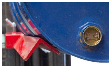
Système de maintien du fût. Évite la déformation et le glissement des fûts.

Par ailleurs, comme rien ne devrait justifier de jeter un produit sous prétexte qu'il soit abîmé, nous sommes en capacité de remettre en état d'usage tous les matériels de notre fabrication et ce, sans limite de durée.