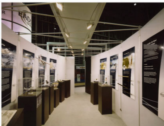
Connecteurs intermédiaires panneaux et panneaux type stand