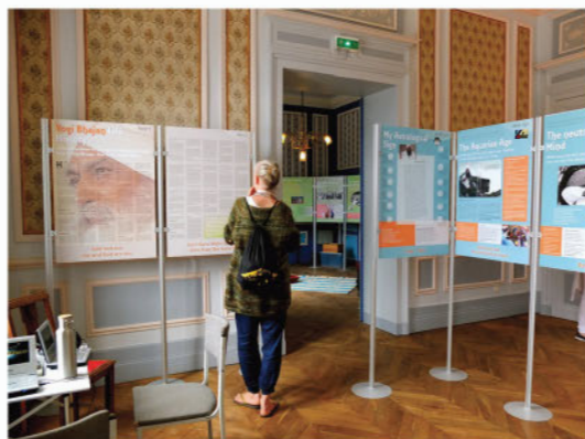
Connecteurs intermédiaires panneaux sur montants avec pied