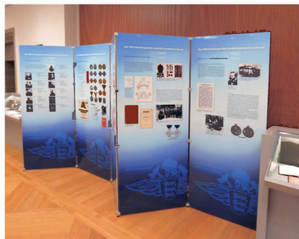
Connecteurs multifonctions panneaux et panneaux

Expomobile peut également vous proposer des panneaux d'exposition dans toutes les matières, dans tous les formats, imprimés ou non.