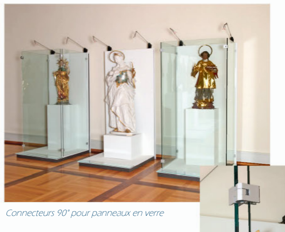
Connecteurs 90° pour panneaux en verre